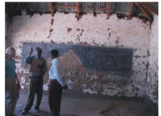
Klassenraum der 1. Klasse vor dem Abriss